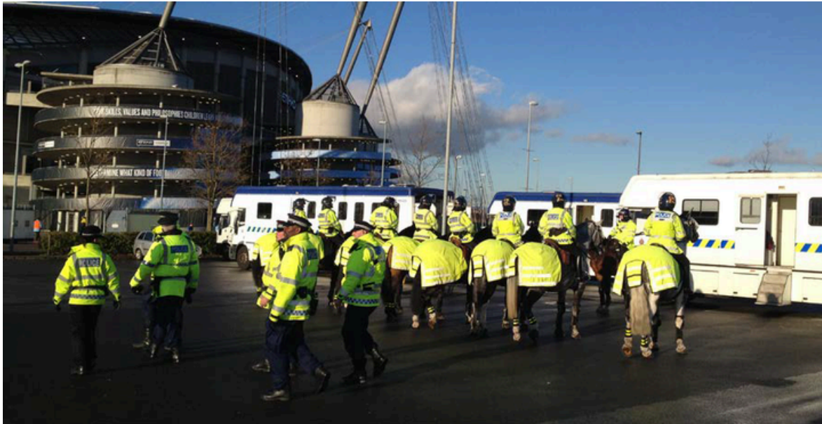
As Forças de Segurança desempenham um papel crucial para garantir a segurança nos espaços públicos, mas também no perímetro privado de segurança dos recintos desportivos quando a ordem pública necessita ser mantida ou restaurada