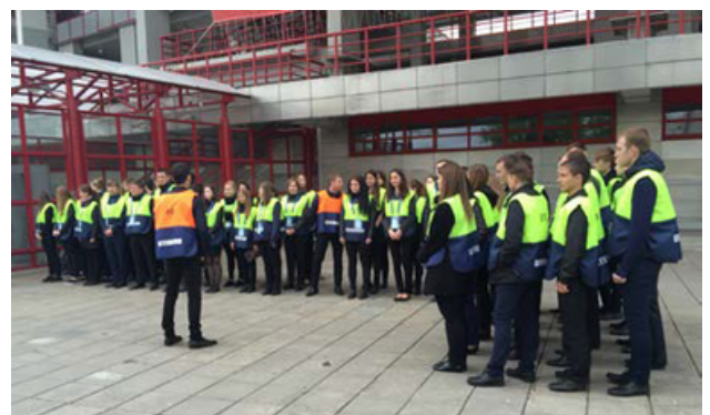
Os Assistentes de Recinto Desportivo desempenham um papel fundamental para garantir a proteção nos recintos desportivos e no perímetro privado de segurança